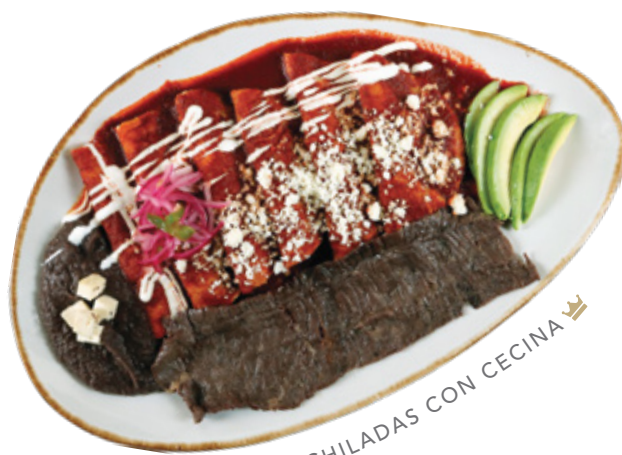
ENCHILADAS CON CECINA