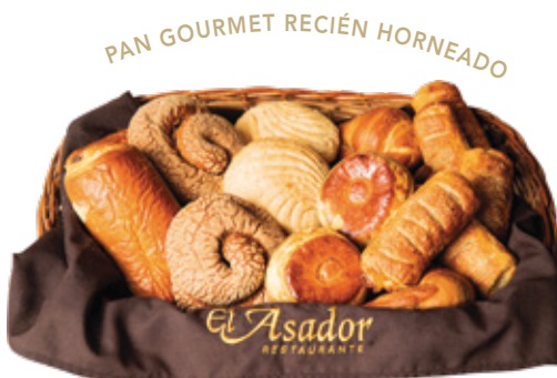
PAN GOURMET RECIÉN HORNEADO