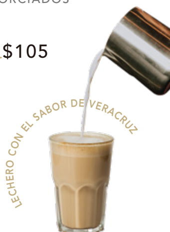
LECHERO CON EL SABOR DE VERACRUZ