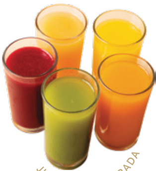
JUGO DE TEMPORADA

El paquete es por persona, no es transferible.