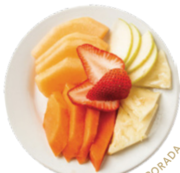
FRUTA DE TEMPORADA