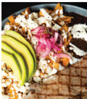
CHILAQUILES CON SÁBANA DE RIB EYE