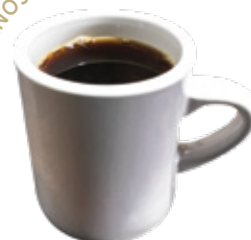
CON GRANOS DE LA REGIÓN