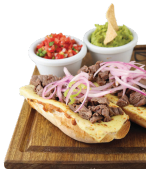
MOLLETES CON ARRACHERA